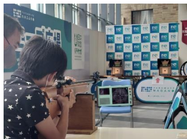
10m先の直径5cm弱の的を狙います